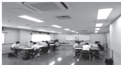
▲JST基本コース研修内でのグループ討議の様子 (令和2年7月15日～17日に実施)