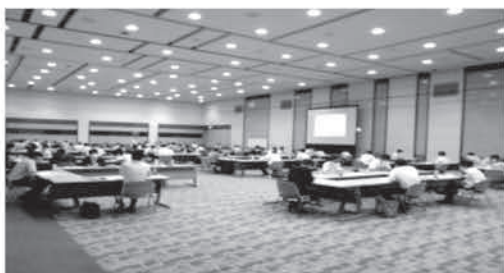
▲中級職員研修内でのグループ討議の様子 (令和2年7月27日～29日に実施)

係長相当職の職員を対象に、職場におけるマネジメント、リーダーシップおよびコミュニケーション能力の向上を目的とした課程の研修を行います。